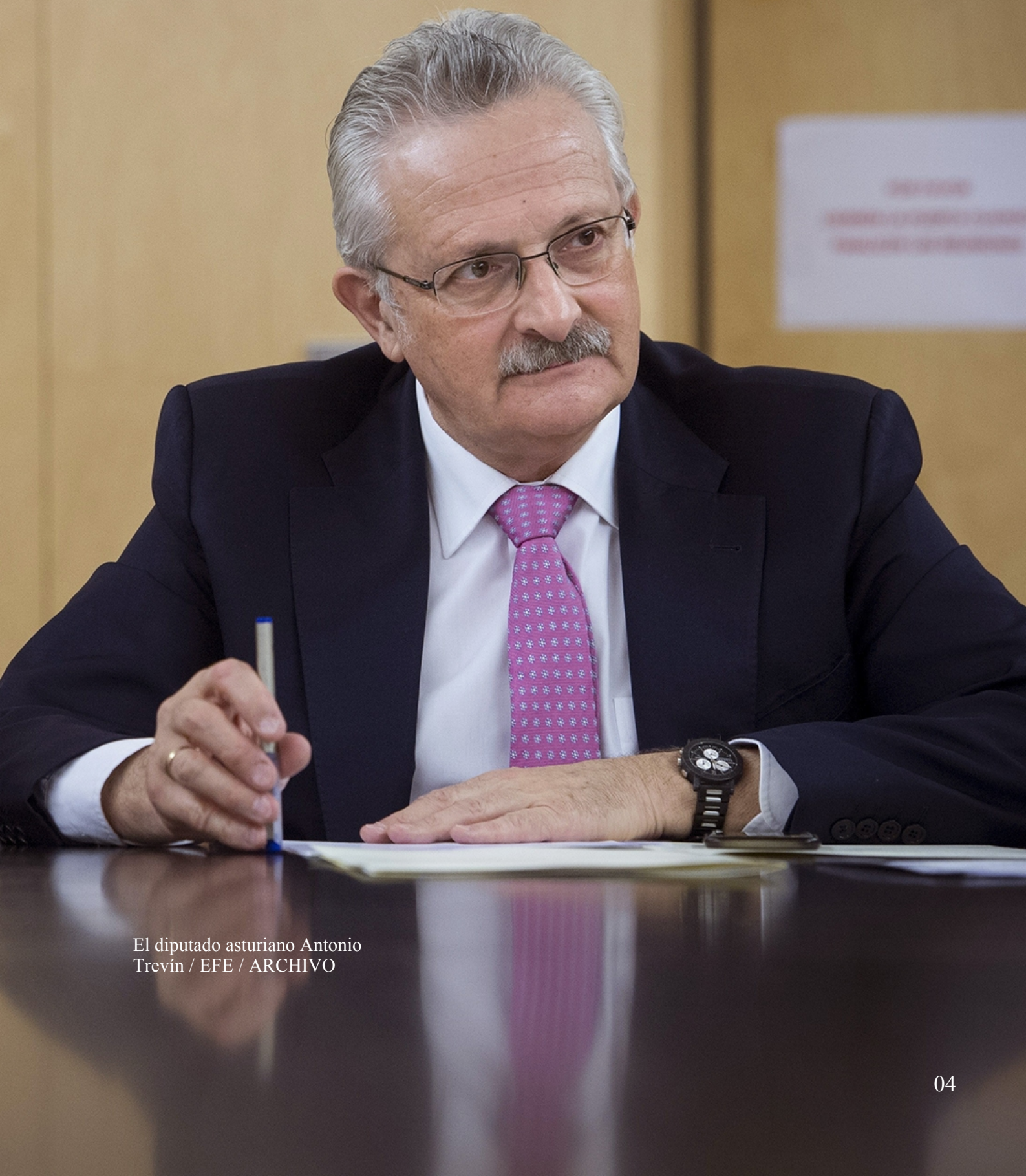
El diputado asturiano Antonio Trevín