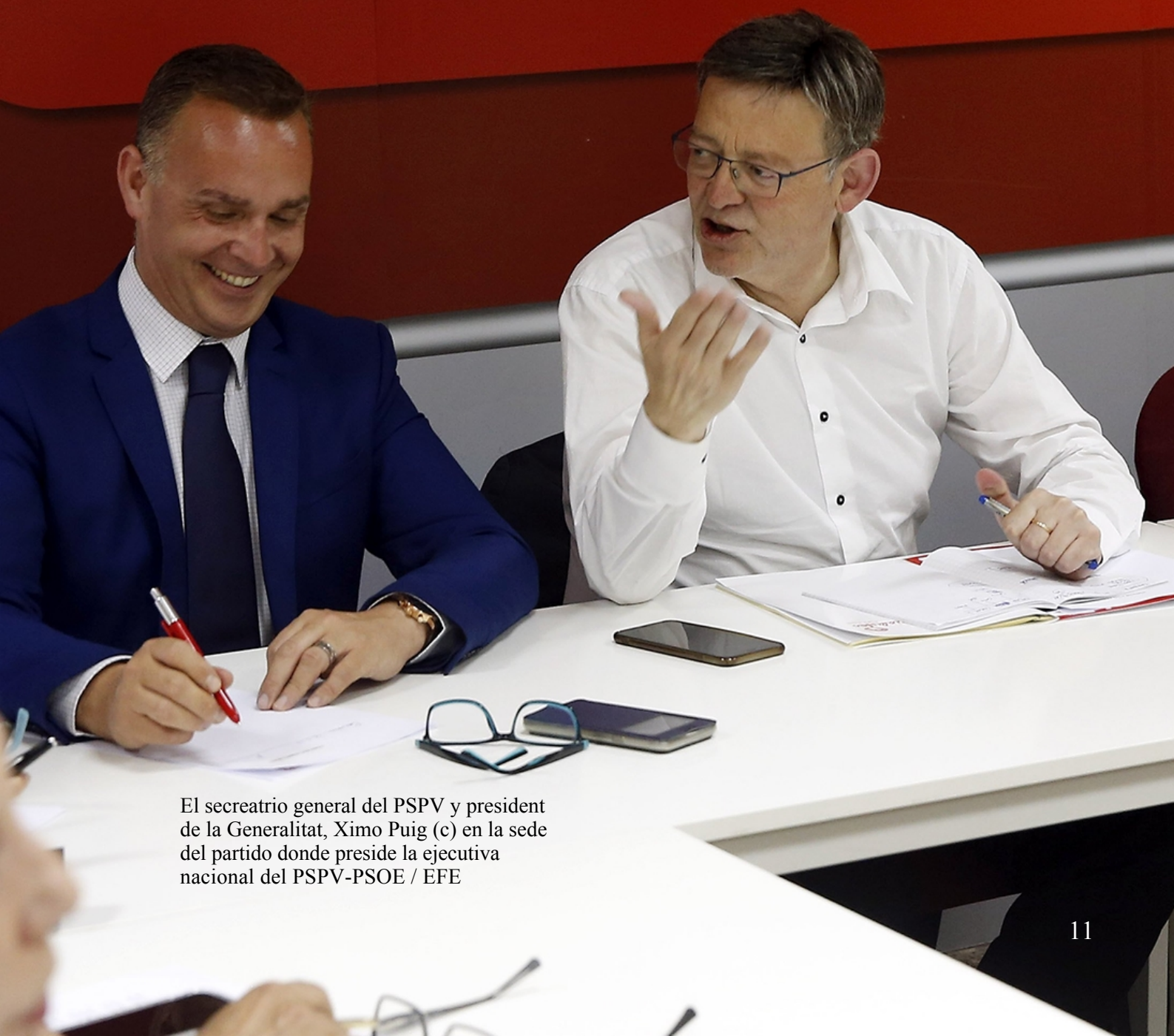
El secretario general del PSPV y presidente de la Generalitat, Ximo Puig (c) en la sede del partido donde preside la ejecutiva nacional del PSPV-PSOE