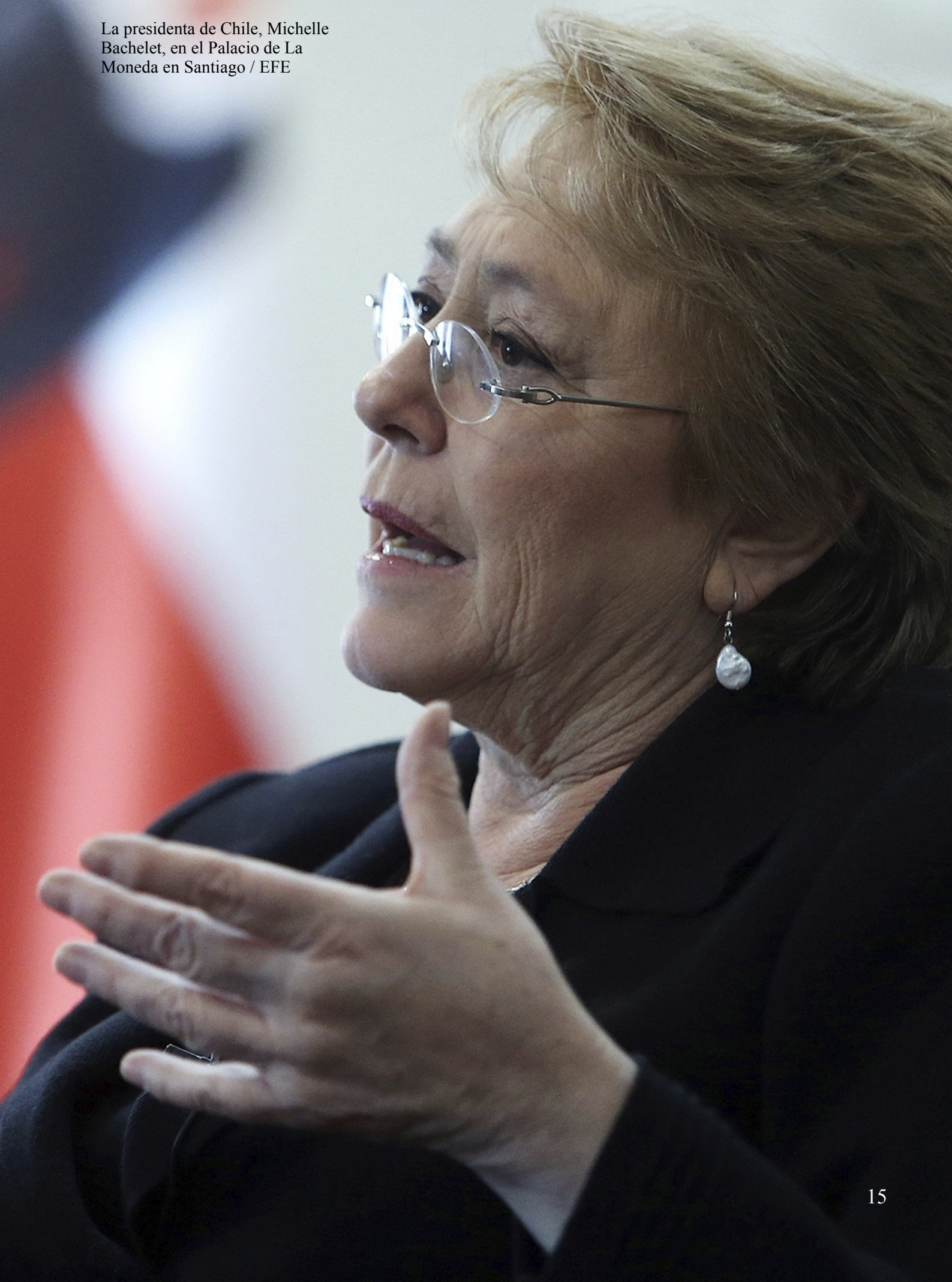
La presidenta de Chile, Michelle Bachelet, en el Palacio de La Moneda en Santiago