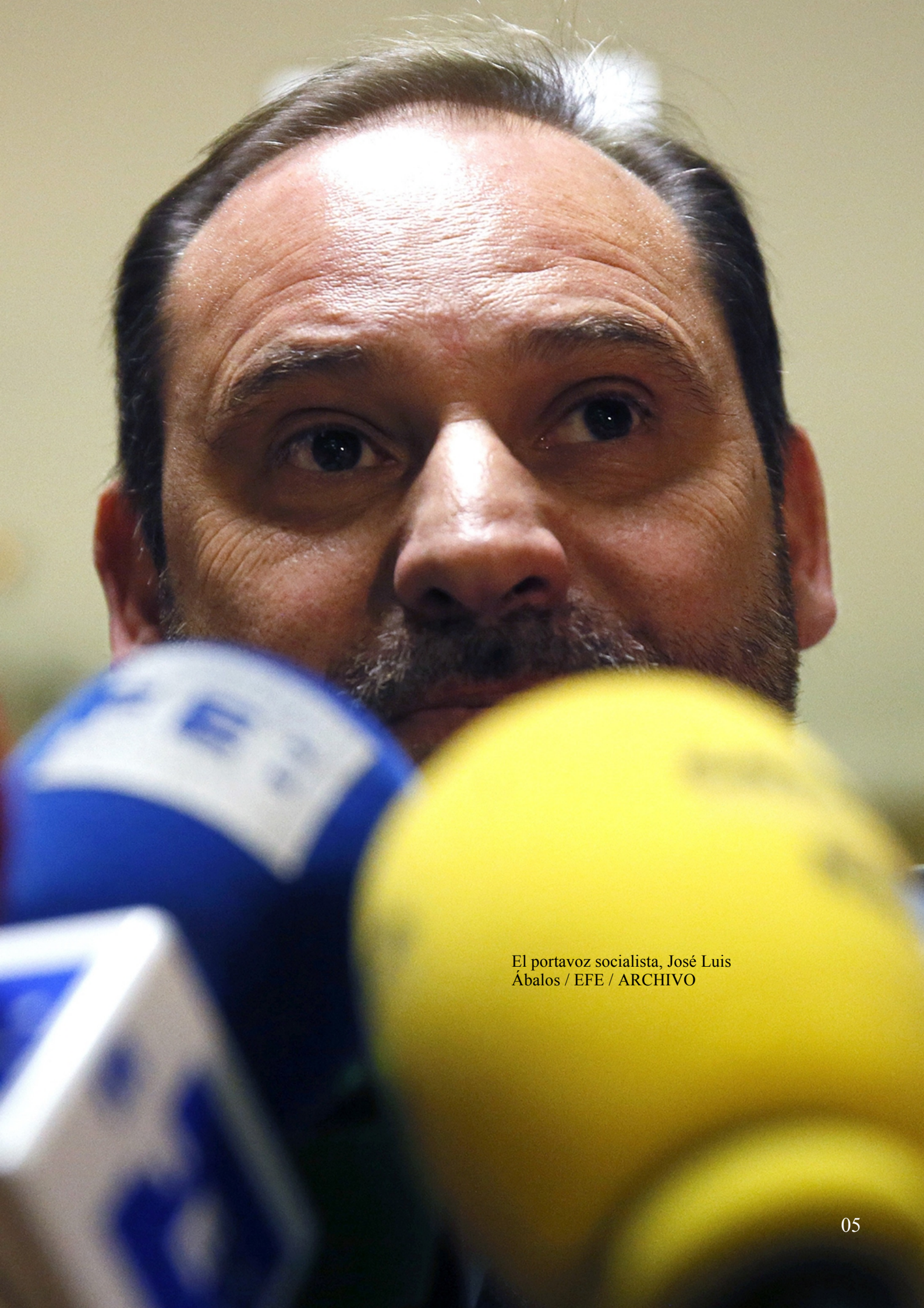
El portavoz socialista, José Luis Ábalos